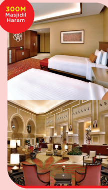
MARRIOT MAKKAH 15 Zulhijjah - 01 Muharram