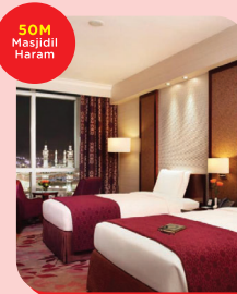
ROTANA CLOCK TOWER 15 Zulhijjah - 21 Zulhijjah