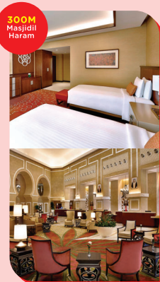
MARRIOT MAKKAH 15 Zulhijjah - 01 Muharram ★★★★★