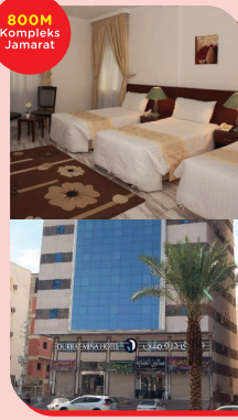
DURRAT 01 - 15 Zulhijjah

Penginapan di Durrat secara BERKELOMPOK mengikut JANTINA