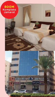
DURRAT 01 - 15 Zulhijjah ★★★★☆