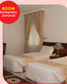
DURRAT 01 - 15 Zulhijjah