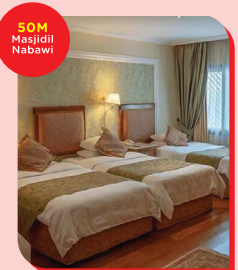
OBEROI 21 Zulhijjah - 25 Zulhijjah